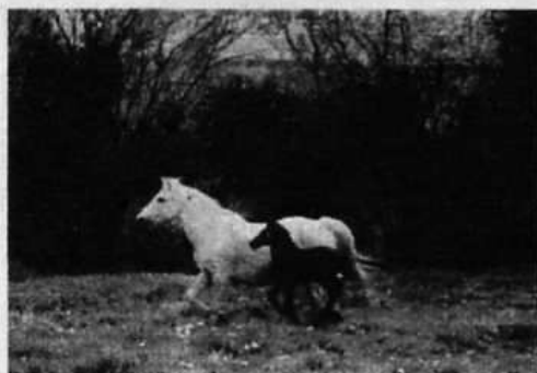
Le poulain reste toujours auprès de sa mère car il est aveugle durant une période de plusieurs jours